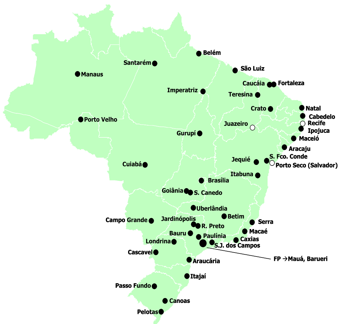
Figura 1 Unidades de Engarrafamento de GLP

Atualmente, existem no Brasil 124 unidades de engarrafamento pertencentes às 17 empresas distribuidoras autorizadas pela ANP a atuar neste ramo. Como mostra a figura 1, estas unidades estão localizadas em 52 cidades. Após o engarrafamento, os vasilhames de GLP são repassados a uma rede de cerca de 35 mil revendedores que irão entregar o produto aos consumidores nos 5.560 municípios do país. Dependendo da distância entre a unidade de engarrafamento e a residência do consumidor, e da geografia de cada região, a logística de distribuição poderá requerer os mais variados tipos de veículos, como caminhões, utilitários, embarcações fluviais, motocicletas, bicicletas e carroças.